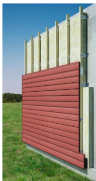
Mise en place d'un pare-pluie