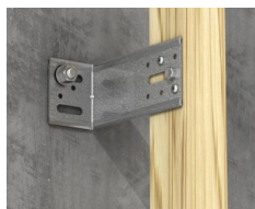
Fixation de chevron